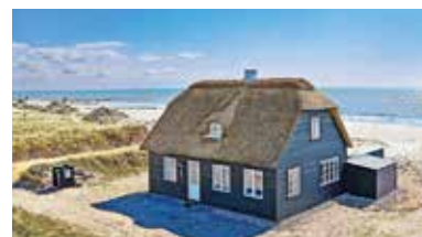
Jutland, Syddanmark, Dinamarca - 82298