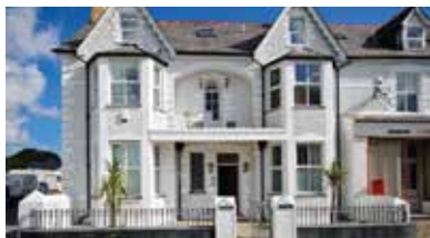
North Wales, Groot Brittanië - GB-00005-42