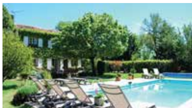
Midi-Pyrénées, Frankrijk - FR-81120-04