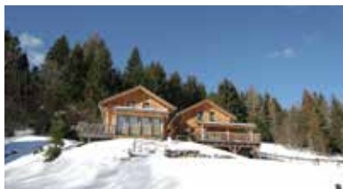
Stadl an der Mur, Steiermark, Oostenrijk - AT-8862-05