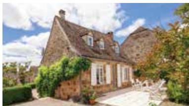
Midden van Frankrijk, Dordogne, Frankrijk - FR-00003-50