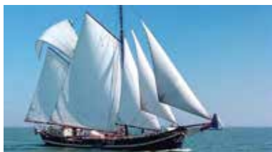
South Holland, Nederland - NL-2315-01