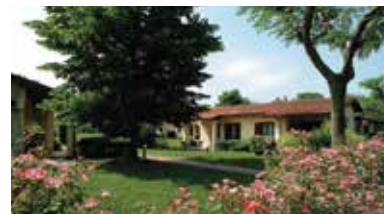
Sirmione, Italian Lakes, Italië - IT-25019-12