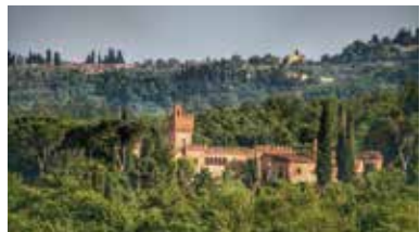
Tuscany, Italië - IT-53047-11