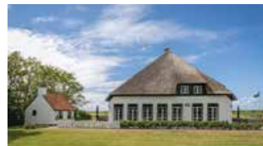
Dutch coast, Texel, Nederland - NL-1795-43